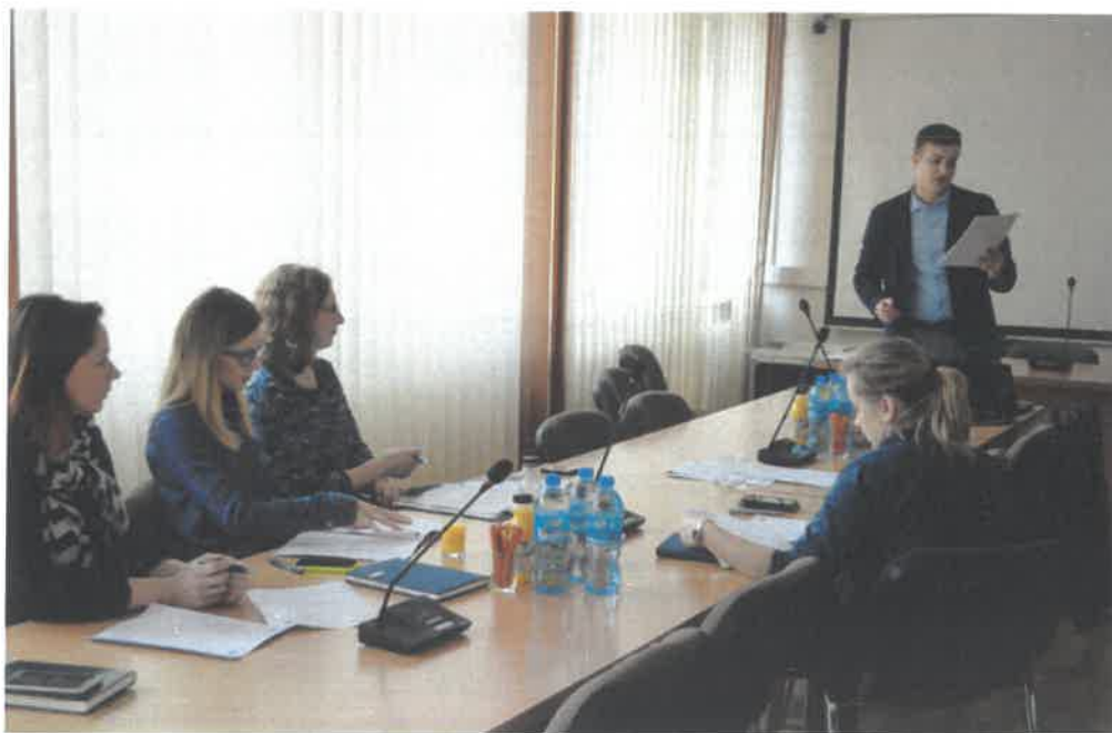
Rycina 55. Spotkanie informacyjne z pracownikami Urzędu Gminy Bobrowniki