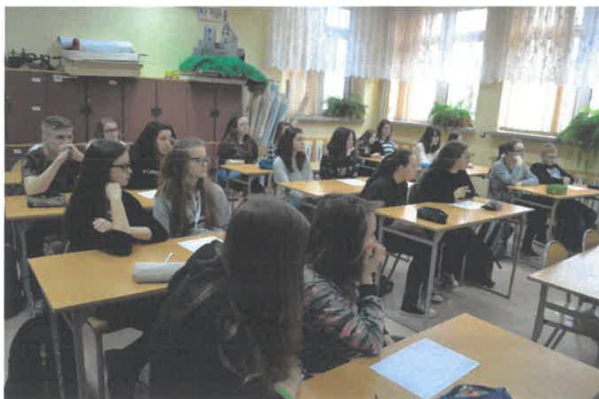
Rycina 54. Warsztaty w Gimnazjum w Siemoni