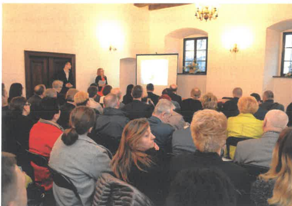
Rycina 56. Pierwsze konsultacje społeczne

spotkania z uczniami szkół podstawowych i gimnazjów (opisane szczegółowo powyżej). Kolejnym etapem spotkania była dyskusja na temat mocnych i słabych stron Gminy Bobrowniki oraz szans i zagrożeń zewnętrznych (analiza SWOT). Podczas spotkania wskazano również, które miejsca w Gminie wymagają szczególnego wsparcia i ożywienia oraz jakiego rodzaju działania rewitalizacyjne powinny zostać przeprowadzone w pierwszej kolejności. Podczas spotkania mieszkańcy otrzymali do uzupełnienia ankiety, które wykorzystane zostały do diagnozy podobszarów rewitalizacji.